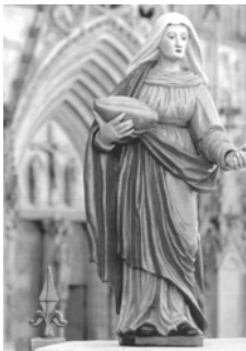
Heilige Elisabeth, bitte für uns!

Gebet um geistliche Berufe: Allmächtiger Gott, Herr Deiner Kirche, gieße Deinen Heiligen Geist über und aus. Schenke uns Priester- und Ordensberufe. Begeistere junge Menschen für die Nachfolge Deines Sohnes Jesus Christus, damit sie Zeugnis geben von Deinem Geist der Liebe und der Hoffnung in unserer Welt und Zeit. Seit 2000 Jahren rufst Du Männer und Frauen als Ordensleute, die alles verlassen, um zu zeigen, dass Gott unter uns ist. Führe sie auf dem Weg des Heiles, gib, dass sie sich um den Geist der Armut, der Ehelosigkeit und des Gehorsams bemühen und Dir und den Menschen dienen. Lass uns alle ein Segen sein für die Menschen in unserem Thüringer Land – im Eichsfeld und in der Diaspora. Allen, die uns begegnen, wollen wir Deine Wahrheit bezeugen heute und an allen Tagen, bis wir Dich schauen dürfen in der Ewigkeit. Amen.